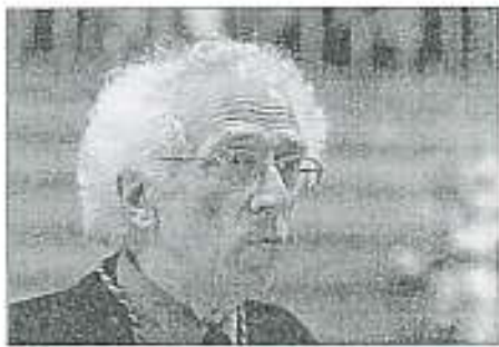
Todorov es el nuevo Príncipe de Asturias de Ciencias Sociales.

Democracias. Además, incide en que su obra, traducida a 25 idiomas, abarca los grandes temas contemporáneos como el desarrollo de las de-