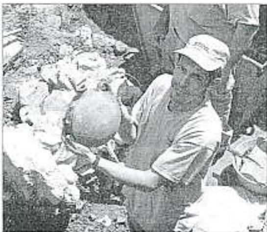
Una cantimplora de época calfal encontrada en la excavación. (R. B.)