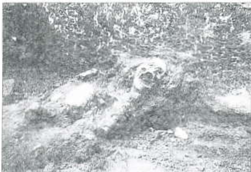
Detalle del hallazgo, con uno de los esqueletos en primer plano a modo de ejemplo.

El hecho de que tales restos se encontraran en una zona de 3 metros por debajo del suelo actual hace toda la investigación.